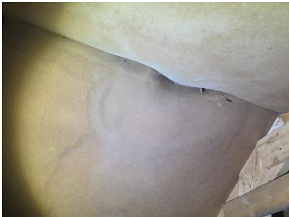
Spår av läckage inne på vinden.