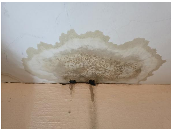
Fuktfläck i taket i klädkammaren, under badrummet.