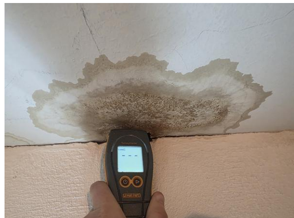
Torrt vid besiktningstillfället.