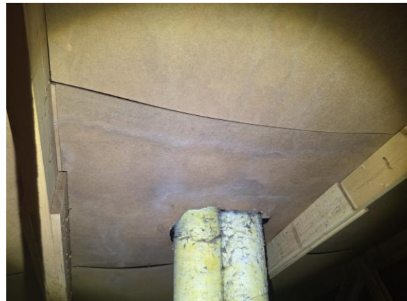
Spår av läckage inne på vinden.